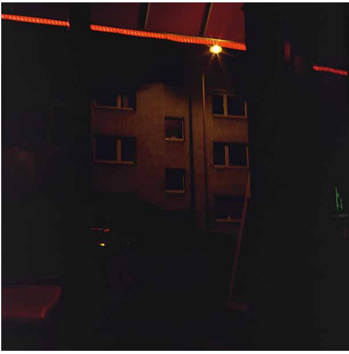
SEM TÍTULO. SÉRIE SOBRE UMBRAIS E AFINS I, 2028 IMPRESSÃO A JATO DE TINTA SOBRE PAPEL DE ALGODÃO 100 x 100CM ED. 1/3 + 2 P.A.