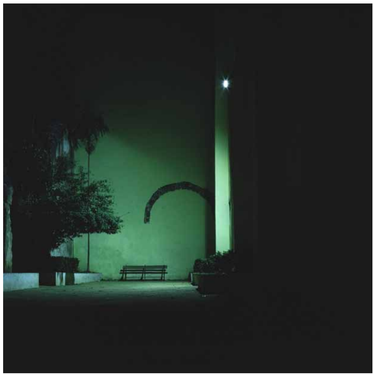
SEM TÍTULO. SÉRIE SOBRE UMBRAIS E AFINS II, 2028 IMPRESSÃO A JATO DE TINTA SOBRE PAPEL DE ALGODÃO 100 x 100CM ED. 1/3 + 2 P.A.